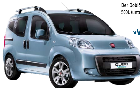
Der Qubo 1.4 8V emittiert nur 119 Gramm CO 2 pro Kilometer.

»Von Fiat gibt es fünf tolle Erdgas-Modelle für jeden Bedarf. Wir beraten Sie hierzu gerne.«