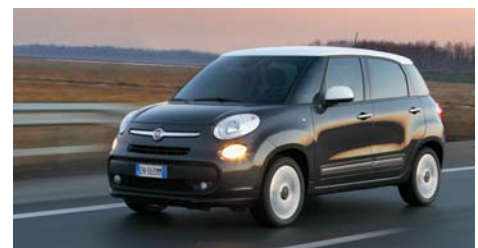
Der Doblò 1.4 T-Jet 16V (oben) stößt lediglich 134, der 500L (unten) sogar nur 105 Gramm CO 2 pro Kilometer aus.